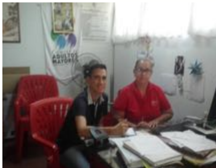
cambiar a donde esta el texto